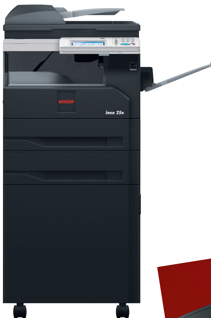
ineo 25e s zásobníkem papíru (PF-508), velkým stolem (SCD-26L) a externí oddělovací přihrádkou (JS-604)

Pokud do kanceláře hledáte kompaktní, pohodlné a snadno použitelné zařízení, které dokáže tisknout, kopírovat, skenovat a faxovat, nenajdete lepší řešení než ineo 25e od DEVELOPU. Toto černobílé multifunkční zařízení je ideální pro malý tým jakékoli firmy.