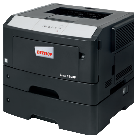
ineo 3300P s přídatnou kazetou na 550 listů (PF-P12)

Pokud je systém ovládání vaší současné tiskárny zoufale komplikovaný a je obtížné ji používat, je na čase vyměnit ji za tiskárnu ineo 3300P. Její snadné používání při každodenním tisku ušetří vám i vašim zaměstnancům čas a spoustu úsilí. A před použitím této nové tiskárny nikdo nebude muset zkoumat návod k obsluze.