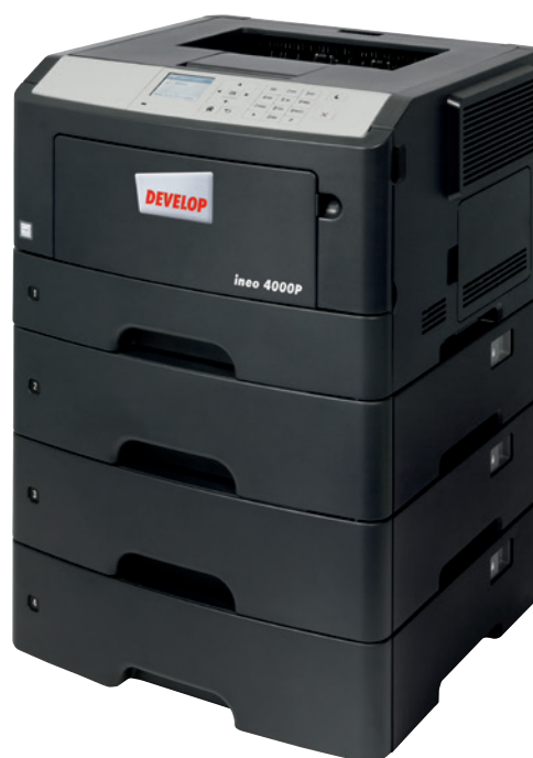
ineo 4000P se třemi dalšími kazetami na papír (PF-P11)

Pokud je systém ovládání vaší současné tiskárny zoufale komplikovaný a je obtížné ji používat, je na čase ji vyměnit za tiskárnu ineo 4000P. Její 6centimetrový barevný displej zajišťuje intuitivní obsluhu a zvýrazněné menu zobrazuje uživatelům stav systému, možnosti obsluhy a nastavení. A co víc, koncept navigace ve stylu složek značně zjednodušuje obsluhu ineo 4000P oproti mnoha starším systémům. To šetří váš čas a úsilí vašich zaměstnanců při každodenním tisku. A před použitím této nové tiskárny nikdo nebude muset zkoumat návod k obsluze.