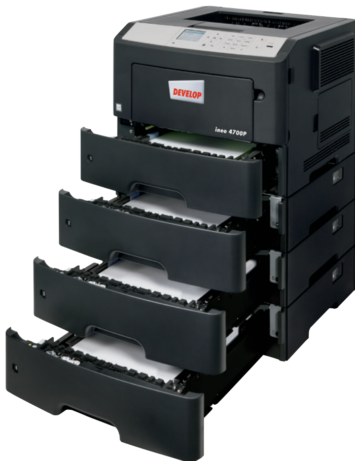
ineo 4700P se třemi dalšími kazetami na papír (PF-P12)

A co víc, oproti mnoha starším systémům zjednodušuje obsluhu ineo 4700P koncept navigace ve stylu složek. To šetří váš čas a úsilí vašich zaměstnanců při každodenním tisku. A před použitím této nové tiskárny nikdo nebude muset zkoumat návod k obsluze.