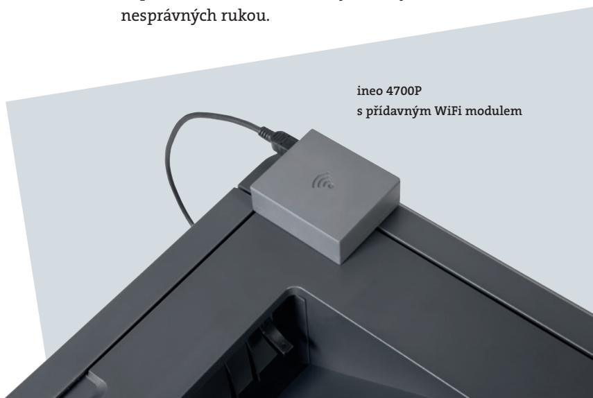
ineo 4700P s přídatným WiFi modulem

Pokud ve vaší kanceláři není moc místa nebo potřebujete speciálně stolní tiskárnu, jsou velkými výhodami tiskárny ineo 4700P lehká konstrukce a malý půdorys. Skutečnost, že tuto vysoce výkonnou kancelářskou tiskárnu lze snadno umístit na stůl a nepotřebuje vlastní prostor, je velmi výhodná pro pracovníky v osobním nebo finančním oddělení, kde by například důvěrné dokumenty neměly skončit nesprávných rukou.