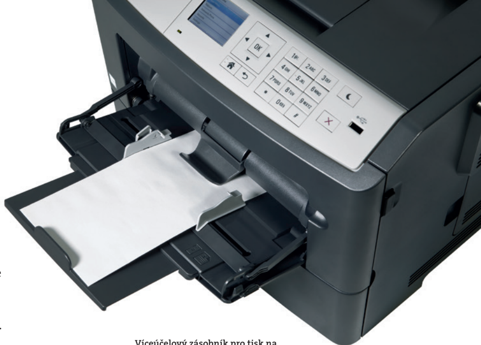
Víceúčelový zásobník pro tisk na speciální média, například obálky

* Poznámka: kazety PF-P11 nebo PF-P12 lze libovolně kombinovat do max. počtu 3 kazet.